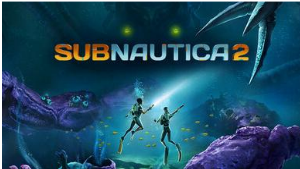
▲ [사진=Subnautica 2 공식 스팀 상점 페이지]