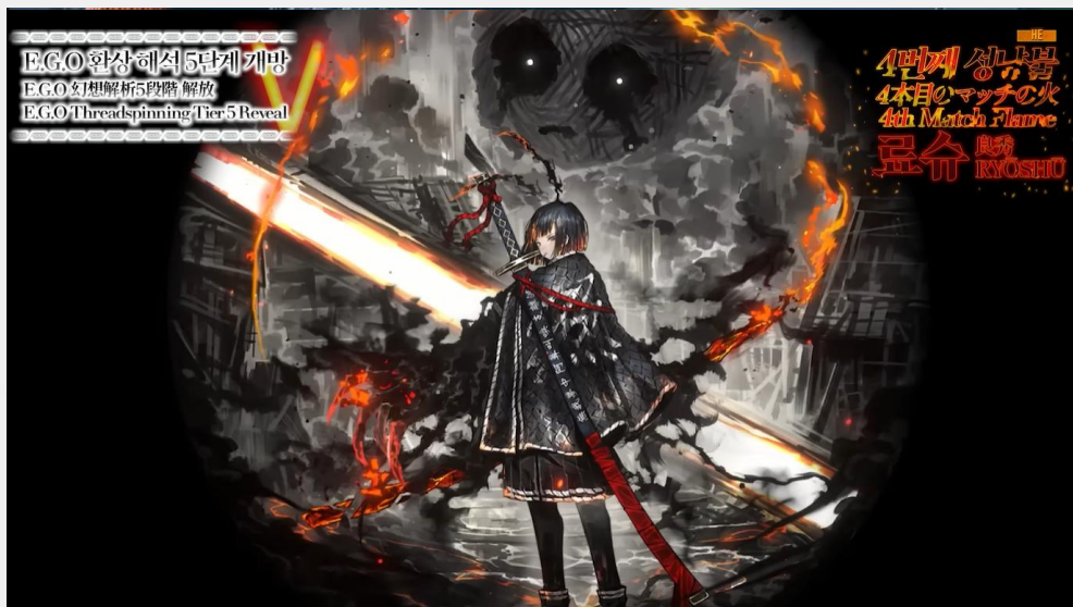
▲ [사진= Project Moon 공식 유튜브 PV 트레일러]