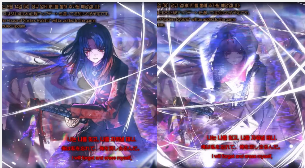
▲ [사진= Project Moon 공식 유튜브 PV 트레일러]