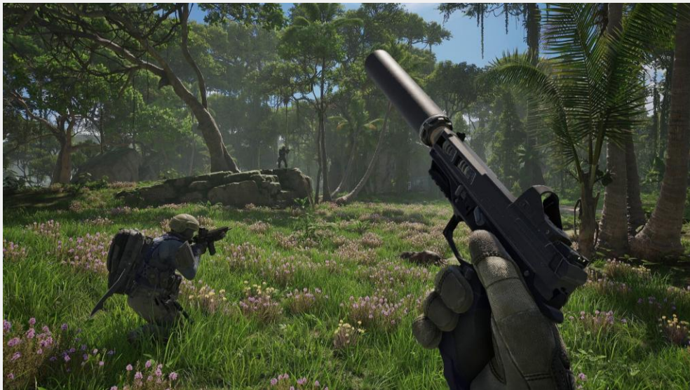
▲ [사진= PUBG: Black Budget 공식 스팀 상점 페이지]